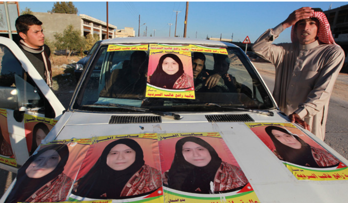
Dans la ville d'Al Mafrqa, à côté d'Amman, des partisans affichent leur soutien à leur candidate en apposant sa photo sur leur véhicule, 19 janvier 2013.

(sur 68) au Sénat. Les élections de 2013 ont permis aux femmes de pratiquement doubler le nombre de sièges qu'elles occupent à la chambre basse (soit 18,6 %) et d'atteindre 26,5 % à la chambre haute. L'élection de Peris Pesi Tobiko, première femme maasaï à faire son entrée au parlement, ainsi que de cinq femmes sénatrices (sur les 18 sénatrices siégeant actuellement) âgées de 24 à 33 ans, ont figuré au nombre des événements marquants de l'année 2013. Il est en revanche à déplorer que la disposition constitutionnelle interdisant qu'un sexe détienne plus des deux tiers des sièges d'une assemblée n'ait pas permis aux femmes de remporter le moindre siège dans plus de la moitié des assemblées régionales du pays.