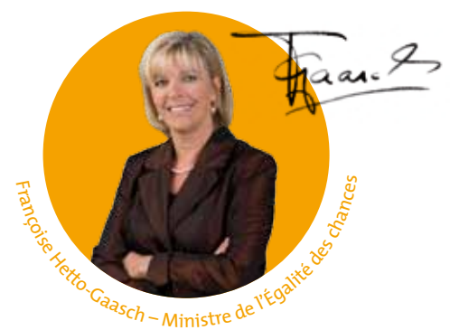
Françoise Hetto-Gaasch – Ministère de l'Égalité des chances