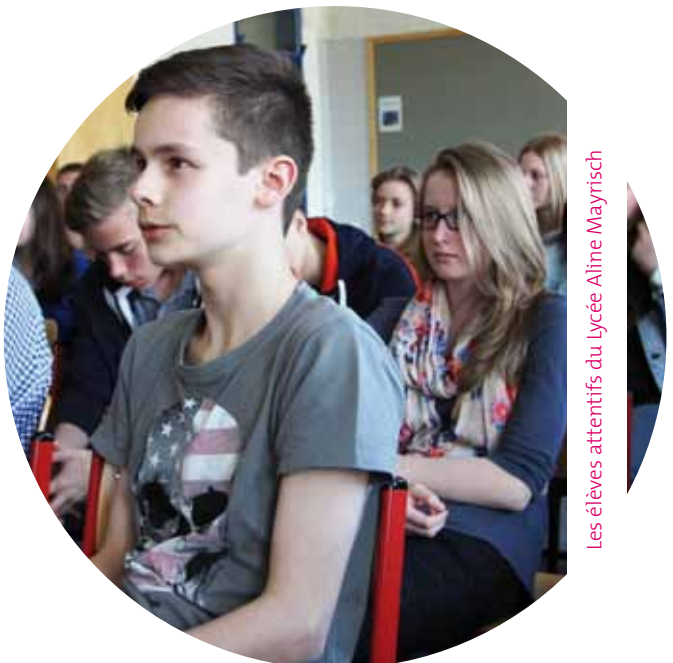
Les élèves attentifs du Lycée Aline Mayrisch

Les jeunes montraient un fort intérêt et intervenaient avec des propos précis et bien réfléchis démontrant ainsi que cette matière est loin de leur être inconnue. >>