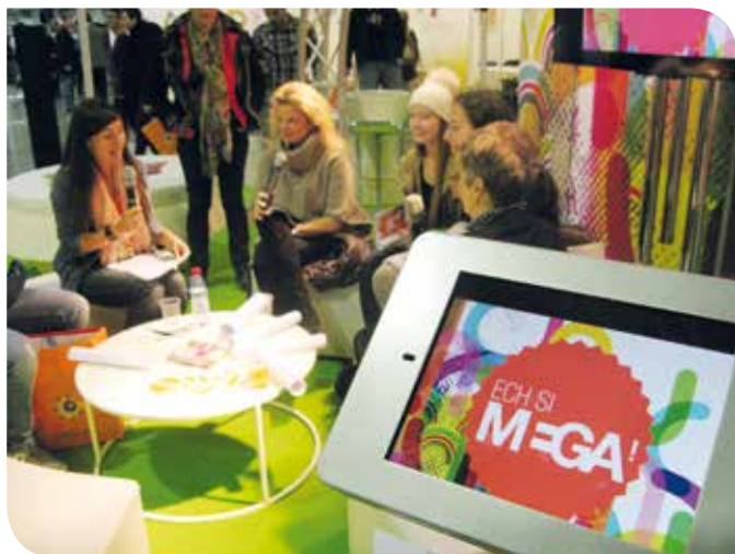
La roue de la fortune digitale tournait toute la journée pour distribuer les premiers cadeaux parmi les jeunes : des clés USB, des t-shirts, ainsi que des pochettes contenant une multitude de gadgets et infos.