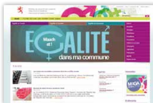
Le nouveau portail internet