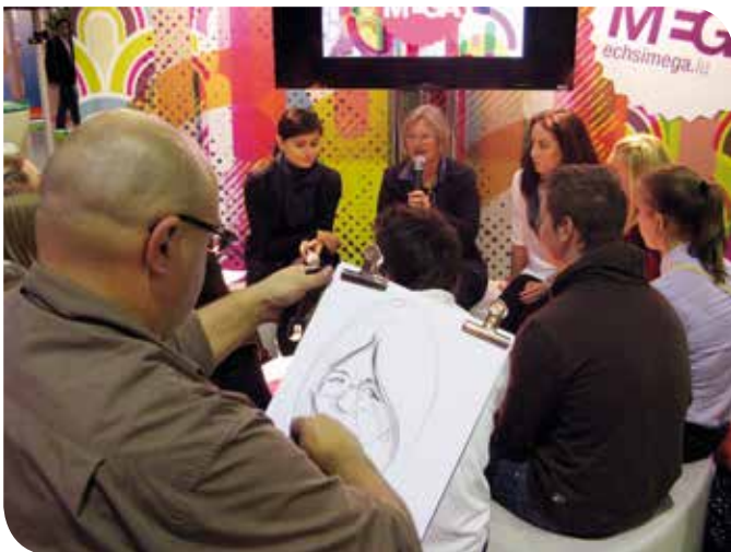
Les caricatures, réalisées par le dessinateur « Lolo », des jeunes femmes et hommes sur le stand ne manquaient pas à attirer l'attention.