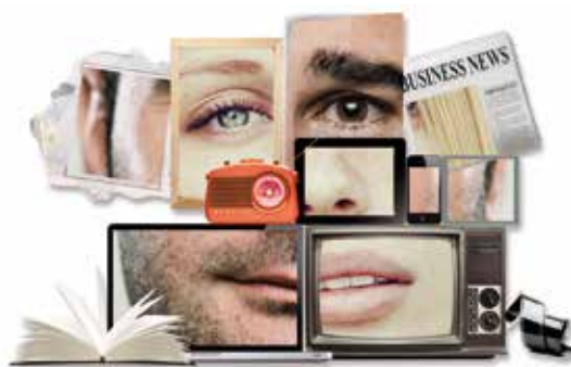
Table ronde « Les stéréotypes dans les médias »