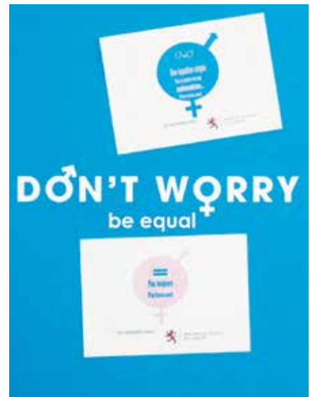
Alter Domus collabore depuis 2008 avec le ministère de l'Égalité des chances pour promouvoir des actions en interne