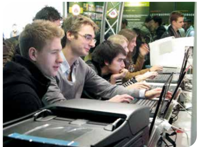
Comme chaque année, les élèves pouvaient faire leur bilan de compétences personnalisé sur ordinateur en étant assistés par des psychologues pour interpréter les résultats. Cette année, la participation a battu tous les records avec 280 bilans réalisés.