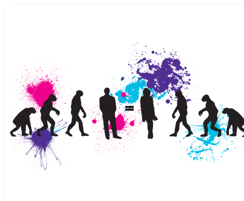
1 er prix : Jil Zepp « Évolution »