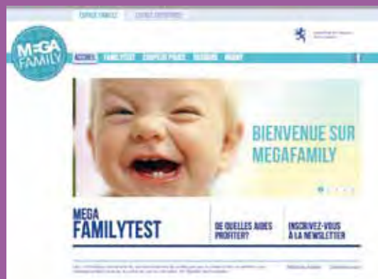
La page d'accueil du site.

Témoignez et faites-nous part de vos actions dans votre entreprise : www.megafamily.lu