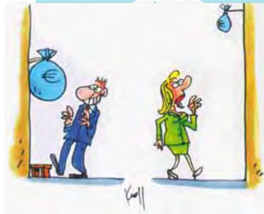
Illustration : Kroll ( http://ec.europa.eu/equalpay )

Pour détecter d'éventuels écarts de salaire dans votre entreprise : www.mega.public.lu/actions_projets/ecart_salaire/logib.html