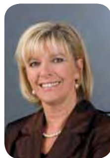
Françoise Hetto-Gasch Ministre de l'Égalité des chances

Bonne lecture à vous tous et toutes et bonnes fêtes de fin d'année.