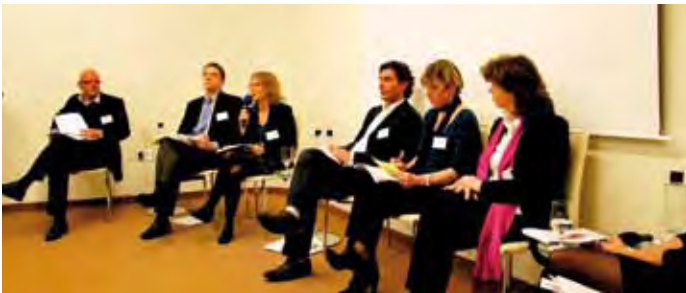
Die Teilnehmer am Rundtischgespräch.

Die Ministerin wies darauf hin, dass die Förderung von Jungen, Männern und Vätern auch den Frauen zugute kommt, Stichwort Vereinbarkeit von Familie und Beruf. „Die Förderung eines Geschlechts geht nicht zulasten des anderen. Sie fördert das gleichberechtigte Miteinander beider Geschlechter in allen Bereichen.“ Das Ministerium für Chancengleichheit muss und will sich in den Dienst beider Geschlechter stellen. Es gilt daher sowohl faire Chancen für Frauen als auch gezielte Maßnahmen und Projekte für Jungen und Männer zu fördern. Es geht also nicht um das gegenseitige Ausspielen der Geschlechter, sondern um eine Politik der Chancengleichheit die ihrem Namen auch gerecht wird.