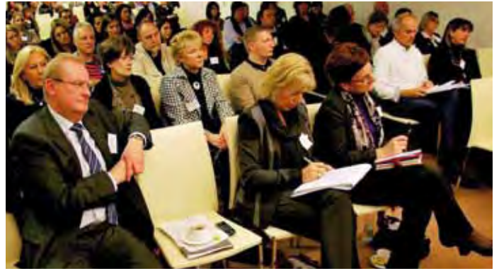
Das interessierte Konferenzpublikum.

Die Bestandsaufnahme zur geschlechtsreflektierten Jungen- und Männerarbeit in Luxemburg wurde Anfang November der breiten Öffentlichkeit durch die Ministerin Françoise Hetto-Gaasch vorgestellt. „Luxemburg steckt, was Jungen- und Männerförderung angeht, noch in den Kinderschuhen“ so die Ministerin für Chancengleichheit, die jedoch auch darauf hinwies, dass bereits eine ganze Reihe von Angeboten und Projekte bestehen. Es bedürfe jedoch einer ganzheitlichen Gesamtstrategie. Viele Angebote sind der Öffentlichkeit weitestgehend unbekannt. Hinzu komme eine gewisse Unsicherheit seitens vieler Einrichtungen auf diesem Gebiet, da es an dem nötigen fachlichen Know-how fehle. Die Studie plädiert daher für eine stärkere Sensibilisierung und Information von Fachkräften, Trägern und Hilfesuchenden, sowie für ein besseres Angebot an Aus- und Weiterbildungsmaßnahmen für Fachkräfte, mehr Praxisaustausch und –begleitung sowie für eine bessere Vernetzung der einzelnen Einrichtungen und deren Angebote.